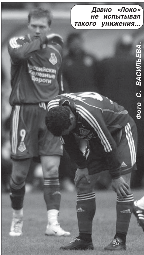
Давно «Локо» не испытывал такого унижения...