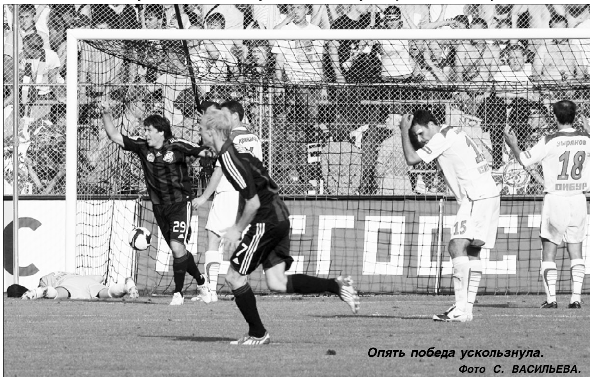
Опять победа ускользнула.

Почему «сине-бело-голубые» не могут играть по счету?