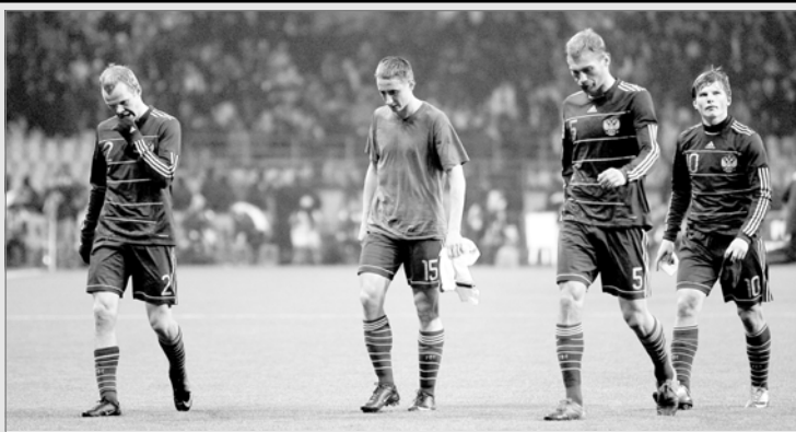
Пока наша сборная не хлебнула лиха в стыковых матчах - о проблемах отечественного футбола даже говорить никто не хотел. Проиграли в Мариборе - начали искать крайнего. Причем, как всегда, не на футбольном поле.

«Турнир четырех» проводить по однокруговой системе на нейтральном поле. При равенстве очков преимущество должны получить те команды, которые в первенстве страны заняли места выше.