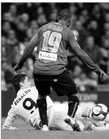
Жесткая опека Патрика Мтиллиги закончилась красной карточкой для Криштиану Роналду.

«Реал» - «Малага» - 2:0. Голы: Роналду, 35 (1:0); Роналду, 39 (2:0). Удаление: Роналду («Реал»), 70.