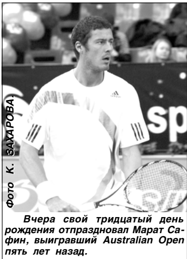
Вчера свой тридцатый день рождения отпраздновал Марат Сафин, выигравший Australian Open пять лет назад.

В четвертьфинале соперником российского теннисиста стал Федерер. Еще год назад можно было быть уверенным: для Давыденко все закончится именно после этого поединка. Две победы над Роджером, в Лондоне и Дохе, изменили мировоззрение болельщиков. Многие были уверены, что и теперь Николай обыграет первую ракетку мира.