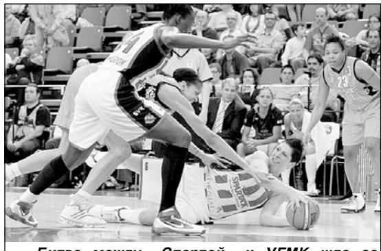
Битва между «Спартой» и УГМК шла за каждый мяч.