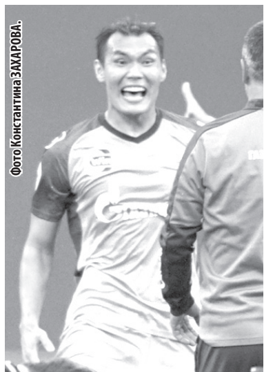
Защитник «Зенита», ставший автором победного гола, прокомментировал победу над «Балтикой» в Суперкубке России.