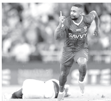
(пенальти - 5:4) Голы: Митрович, 7 (1:0). Яхья, 88 (1:1). Удаления: Оспина («Аль-Наср»), 56. Аль-Булайхи, 87; Кулибали, 90 (оба - «Аль-Хиляль»).

Кубок короля. Финал «Аль-Хиляль» - «Аль-Наср» - 1:1