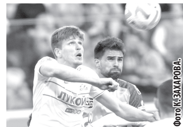
вне зависимости от того, какой мы состав видим на поле – первый или второй. Это отображение всего того, что происходит в испанском футболе, какое он выбрал направление.

игроков. - Да, их значительно больше. - И при этом они оказались не соотнесены в единое целое, не все у них получилось, а главное, что недооценили своего первого соперника – Румынию. Команда явно развалилась после первого пропущенного гола. - Сейчас со стороны Грузии раздаются голоса, что один Кварацхелия стоит всей сборной Испании. Голы от успехов началось? - Возможно, предположу, что «Красная фурия» будет фаворитом в этой встрече. Мы видим, что Испания – это машина, в которую заложен игровой алгоритм понятных действий. Причем