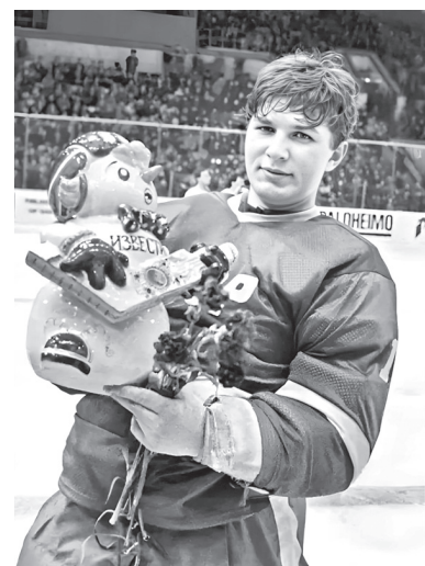
мегазвезда - Гретцки, Мессье, Коффи, Андерсон, Курри...

Иногда, конечно, вспыхивал, напоминал, что «мастерство не пропьешь», как, например, в выставочном матче с «Вашингтоном» в СКК в 1989 году. Причем даже этого хватало, чтобы про него вспомнил не кто-нибудь, а «Эдмонтон» - сильнейший на тот момент клуб НХЛ, где мегазвезда на