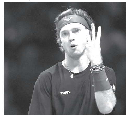
Рублев сделал все что мог

В Малаге стартовал финал Кубка Билли-Джин Кинг с участием 12 сильнейших женских сборных. Увы, российские теннисистки по решению Международной федерации тенниса по чисто политическим причинам отстранены от участия в командном турнире. А вот в Турине, где проходит Итоговый турнир АТР, выступают два наших теннисиста.