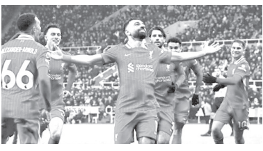
КУБОК ЛИГИ. 1/4 финала

Форвард «Тоттенхэма» красиво отметил 100-летний юбилей удара, который был почти полвека под запретом