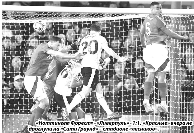
«Ноттингем Форест» - «Ливерпуль» - 1:1. «Красные» вчера не дрогнули на «Сити Граунд» - стадионе «лесников».

«Ливерпуль» вырвал ничью, разница между лидером и чемпионом прежняя - 12 очков