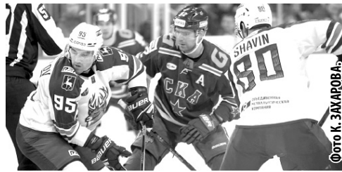
3:1. 6 марта. «Амур» – «Салават Юлаев» - 1:2ОТ; «Адмирал» – «Нефтехимик» - 2:3; «Барыс» – «Сибирь» - 4:1; «Северсталь» – «Витязь» - 3:0; ХК «Сочи» – «Металлург» Мг - 0:3; «Торпедо» – «Авангард» - 2:3. 8 марта. СКА – «Металлург» Мг (17:00).

5 марта. «Динамо» Мн – «Лада» - 4:2; «Спартак» – «Куньлунь РС» - 2:3Б; «Ак Барс» – «Автомобилист»