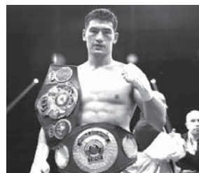
отказался от поединка с американцем Дэвидом Бенавидесом и потерял звание чемпиона по версии WBC.

Первый бой двух российских полутяжелой состоялся 14 октября 2024 года, тогда арбитры присудили победу Артуру, и Бетербиев стал абсолютным чемпионом мира в полутяжелом весе. В февральском реванше 2025-го судьи отдали предпочтение Дмитрию, и уже он стал обладателем всех главных поясов в боксе. В дальнейшем Бивол