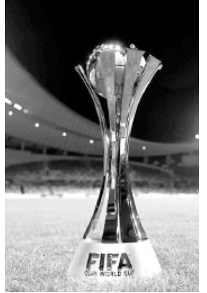
Указаны все финальные матчи клубных чемпионатов мира и Межконтинентального Кубка с 2000 года, когда турниры стали проводиться параллельно, а затем один сменил другой.

Матч №1. 16 июня, 03:00*. «Аль-Ахли» (Египет) - «Интер» Майами (США). «Хард Рок Стэдиум», Майами-Гарденс