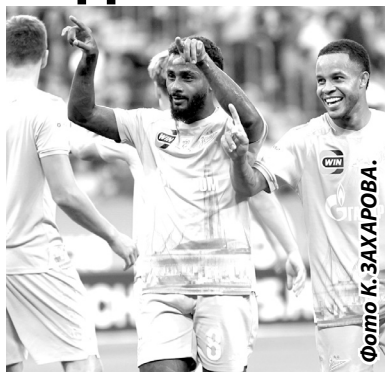
Фоток: ЗАХАРОВА рваться от «Зенита» на девять очков.

Прошла почти треть чемпионата - между командами три очка разницы. Было бы девять очков - тоже не страшно. Когда после двух третей разницы в девять очков, тогда проблема, а сейчас - нет. Плотность верхней части турнирной таблицы настолько велика, что два-три тура могут полностью изменить расположение команд. Я не боюсь ни за кого, хотя больше симпатизирую, конечно, «Зениту». С моей точки зрения, очень хорошо, что чемпионат развивается таким образом: мы будем видеть ожесточённую борьбу за пьедестал, за второе место, третье и так далее.