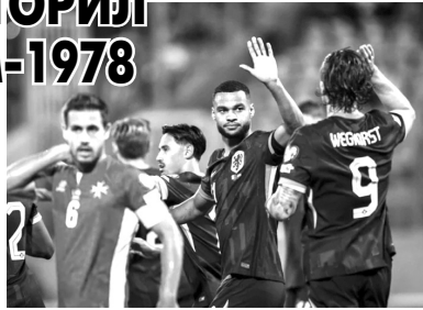
Кипр, Румыния - Австрия. 9-й тур. 15 ноября: Кипр - Австрия, Босния - Румыния. 10-й тур. 18 ноября: Австрия - Босния, Румыния - Сан-Марино.

В четвертьфиналах Испания сыграет с Колумбией, Мексика - с Аргентиной, а Норвегия - с Францией. Ещё одну пару соперников составят победители матчей США - Италия, а также Марокко - Южная Корея.