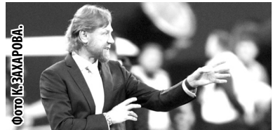
СОСТАВ СБОРНОЙ РОССИИ

- Бью и запугиваю. Шутка. Это товарищеские матчи, здесь ответственность другая. Даже в квалификации всё по-разному: одно дело - третий тур, другое - решающий матч за выход из группы с Хорватией. Психология победителя - хотелось бы, чтобы она была, но проверить это сейчас не можем. Мы над этим работаем. Не ругаем, когда игроки ошибаются, чтобы боязнь ошибиться уходила.