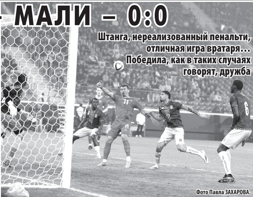
Штанга, нереализованный пенальти, отличная игра вратаря... Победила, как в таких случаях говорят, дружба